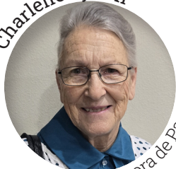
Conductora de Pasco