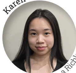
Servicio a Richland