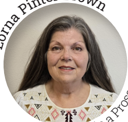
Servicio a Prosser