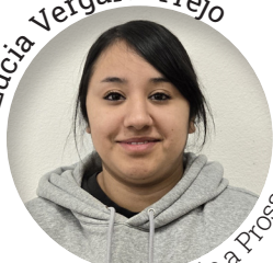
Servicio a Prosser