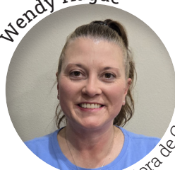
Conductora de Cafe

Para obtener información sobre cómo unirse al increíble equipo devoluntarios de Mid-Columbia Meals on Wheels llame al (509) 735- 1911 o envíen correo electrónico a volunteer@gencare.org .