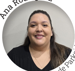
Servicio de Parkside